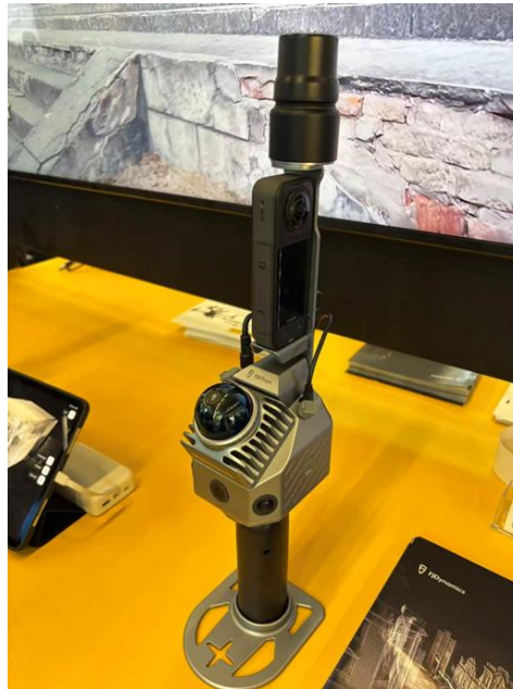
Abbildung 2: Sensor Fusion bei einem handgehaltenen, SLAM-fähigen Mobile Mapping System: FJD Trion

Ein weiterer Trend ist die Integration von 3D Gaussian Splatting (3DGS) in SLAM-Systemen des niedrigeren bis mittleren Preissegments. Diese Technologie ermöglicht die realistische Darstellung eines, verglichen mit traditionellen Meshes, außergewöhnlich hohen visuellen Detailreichtums bei gleichzeitig hoher geometrischer Genauigkeit. Um 3DGS zu ermöglichen, werden existierende handgehaltene Lösungen häufig um zusätzliche optische Panoramakameras, wie beispielhaft in Abbildung 2 dargestellt, erweitert. Die bereits vorhandenen Kameras dienen dabei weiterhin primär dem Anreichern der Punktwolken mit RGB-Informationen. Im Allgemeinen hat sich das Angebot an handgehaltenen Mobile Mapping Sensoren des niedrigen bis mittleren Preissegments im Vergleich mit den vorangegangenen Jahren stark ausgeweitet.