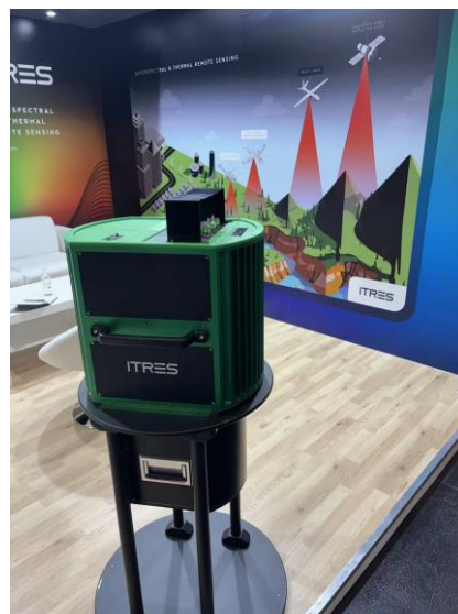
Abbildung 6: Kombination verschiedener Sensoren in einer gemeinsamen Plattform: ITRES SAVI-1000

Auch im Bereich der Erdbeobachtung ist der Trend zur Sensorfusion von Bedeutung. Hier betrifft dies beispielsweise die Integration unterschiedlicher Sensortechnologien in einer gemeinsamen Plattform. Moderne EO-Sensoren kombinieren zunehmend mehrere Messverfahren, wie beispielsweise hyperspektrale und thermale Infrarotsensoren, in einer gemeinsamen Plattform. Ein solches System ist exemplarisch in Abbildung 5 dargestellt. Die Effizienzsteigerung durch die Sammlung mehrerer Datentypen in einem Flug oder Orbit sowie ein Gewinn an Erkenntnissen durch die gemeinsame Auswertung sind besonders relevant für Anwendungen in der Land- und Forstwirtschaft sowie im Umweltmonitoring.