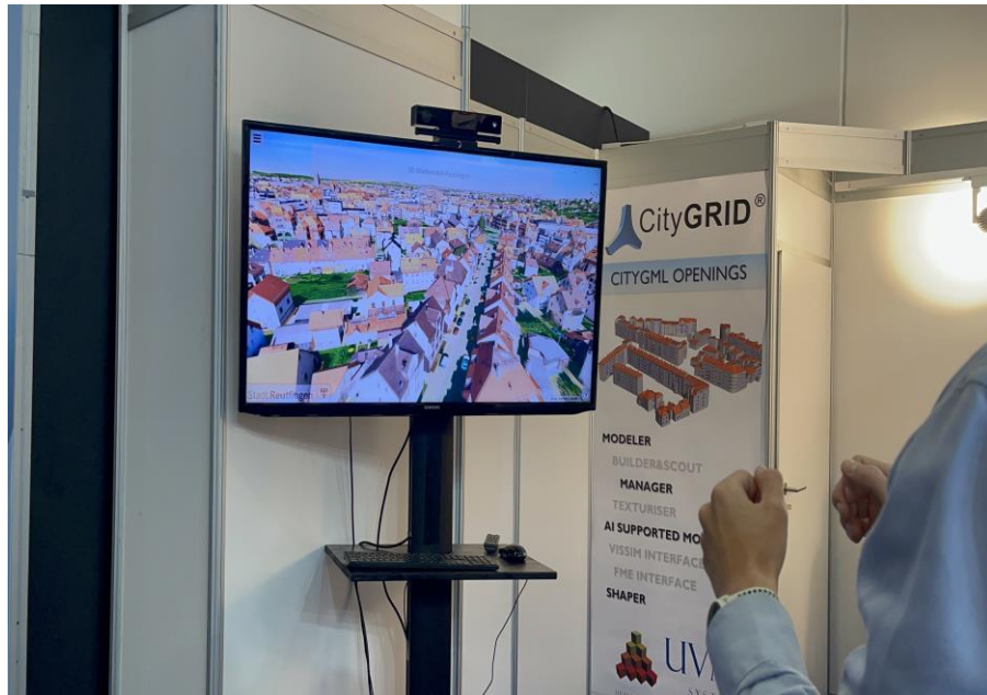
Abbildung 4: Interaktive Visualisierung urbaner digitaler Zwillinge mit einer Game-Engine

Der Einsatz von KI im Rahmen städtischer Plattformen hat zugenommen und ermöglicht Anwendungen wie Datenabfrage in natürlicher Sprache und automatisierte Berichterstattung. Dabei können bestehende Daten bereits existierender digitaler Zwillinge direkt genutzt werden. Durch die Absenkung der technischen Hürden erleichtert KI nicht-fachkundigen Mitarbeitern und Nutzern die Interaktion mit komplexen Geodaten und kann so zur Steigerung der Effizienz von Verwaltungsabläufen beitragen. Immer häufiger integrieren Plattformen intelligente Beratungs- und Entscheidungsunterstützungsfunktionen in Geschäftsprozesse. Ein Beispiel ist hier die KI-gesteuerte Fehlererkennung in Pipelines und anderen Netzwerken. Die Ergebnisse einer solchen Inspektion werden direkt in der Sanierungsplanung, der Kostenschätzung und dem strategischen Vermögensmanagement verwendet.